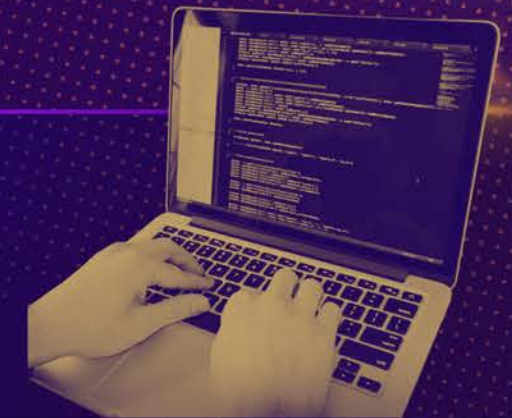
Robotic, Coding, IoT

Robotic, coding, IOT, merupakan cabang kompetisi terbaru dalam FMRG 3.0