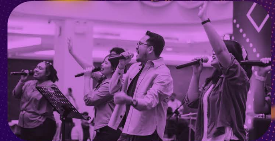
Konser Rohani dan KPI